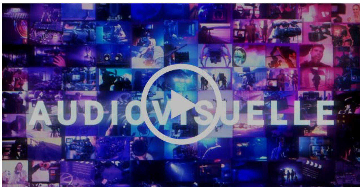
Exemple d'une capsule promotionnelle de 15 secondes produite pour AcademieCine.TV utilisant différentes techniques d'habillage visuel

L'objectif est de favoriser l'esthétisme de l'image et la dynamique de présentation pour bien transmettre le message et se démarquer de la compétition.